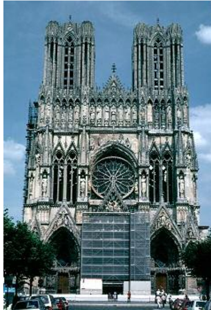
کاتیدرالی ریمز، فەرەنسا Reims